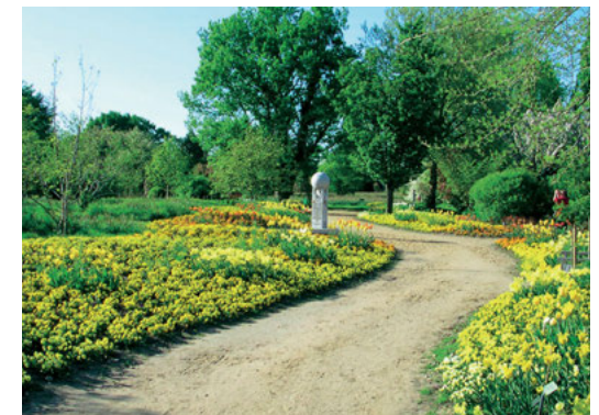
Ausflüge ins Grüne