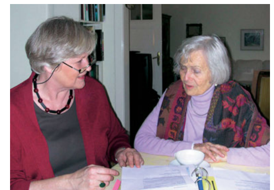
Hilfe beim Schriftverkehr